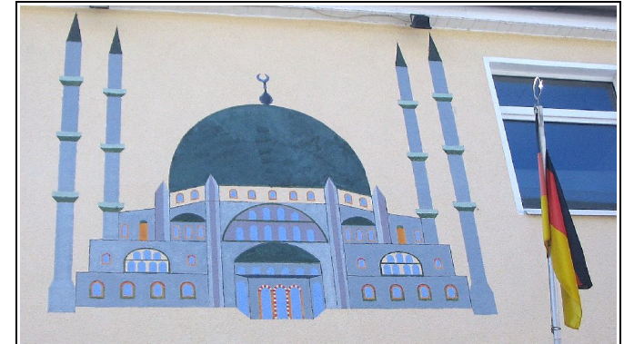
Eine aufgemalte Moschee weist auf den neuen Zweck dieses Siegener Gebäudes hin.

Diese Broschüre will über den Islam informieren und zur Begegnung mit muslimischen EinwohnerInnen in Siegen ermutigen.