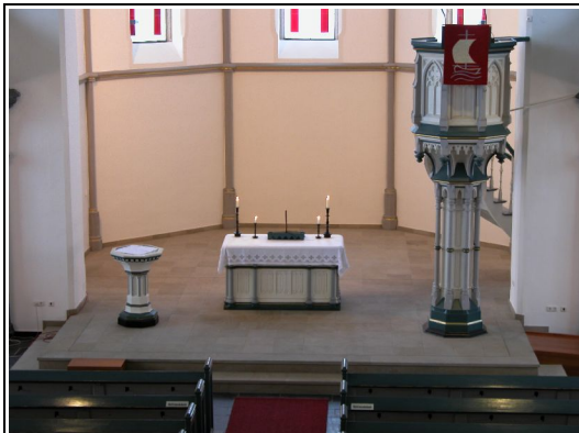
Ein typischer Kirchraum: Bänke, Taufbecken, Abendmahlstisch (oder Altar), Kanzel (zum Predigen)

Die eine spricht französisch, die andere englisch. Sie wollen den Heiligen Geist in besonderer Weise zur Geltung bringen.