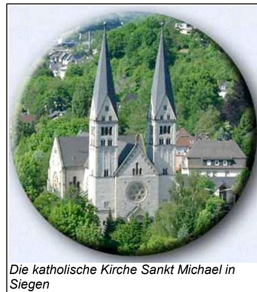
Die katholische Kirche Sankt Michael in Siegen

Der Gottesdienst heißt „Messe“, wenn das Abendmahl gefeiert wird. Katholische Christen verehren Maria, die Mutter Jesu, und andere Heilige.